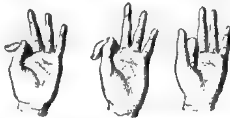
Семьдесятъ. Восемьдесятъ. Девяносто. Фиг. 7.

указательный палецъ, наложенный на согнутый большой палецъ, обозначаетъ . . . . . 60;